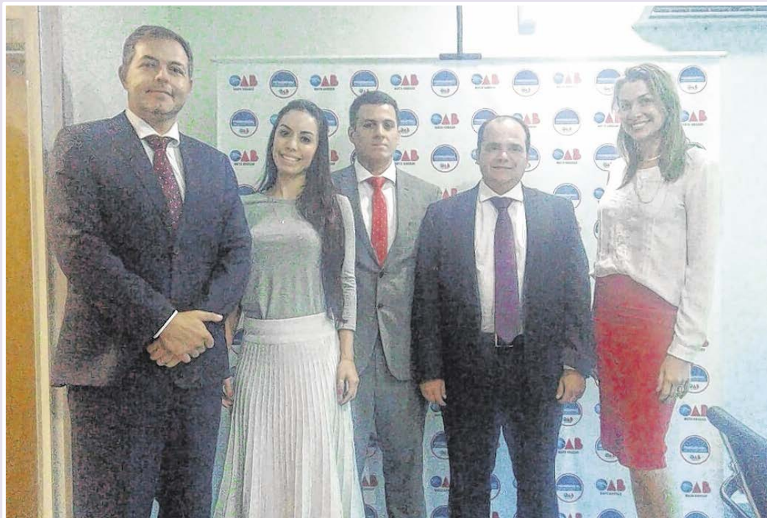
Tabela de honorários está disponível no site da OAB-MT