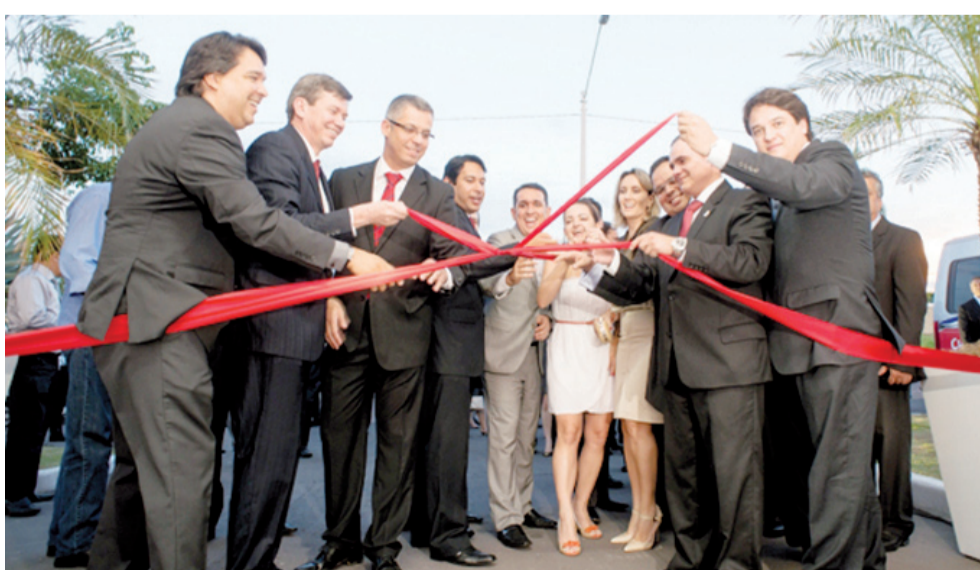
INAUGURAÇÃO DO ESTACIONAMENTO