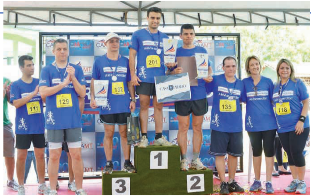
CORRIDA DOS ADVOGADOS

CERTIFICAÇÃO DIGITAL – A CAA/MT realizou a venda de 100 tokens ao valor de R$ 25. O novo preço dos dispositivos representou uma redução de 64% em comparação ao valor normal de