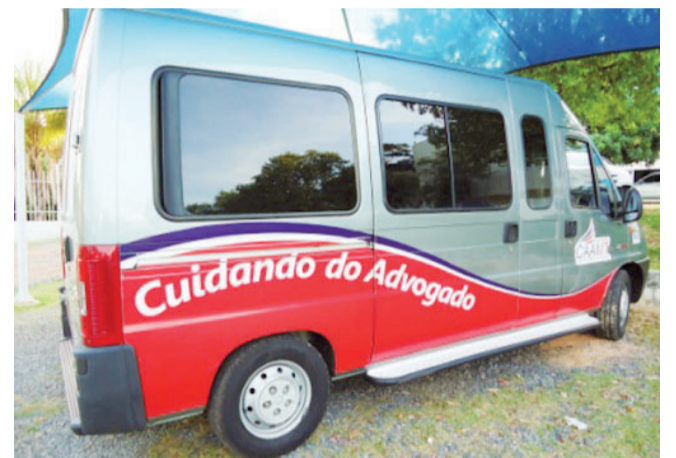
CARAVANA DA CAIXA

COLÔNIA DE FÉRIAS – O projeto direcionado aos filhos e dependentes dos advogados e estagiários com idades entre seis e 12 anos chega a sua 8ª edição, em Cuiabá. Com as atividades programadas para janeiro de 2014, as inscrições foram iniciadas em dezembro.