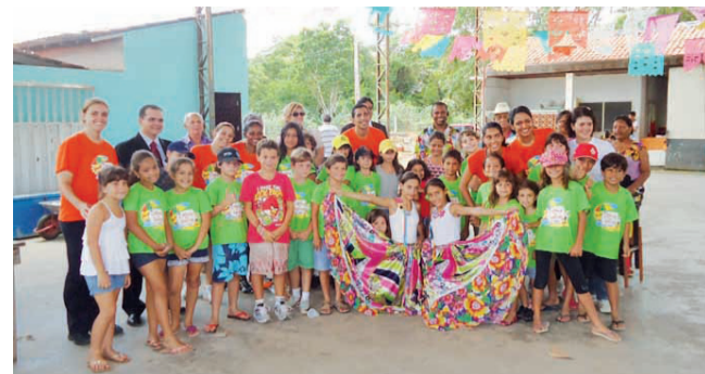
COLÔNIA DE FÉRIAS DE CUIABÁ

- O segundo encontro anual dos Delegados da CAA/MT ocorreu em Rondonópolis, entre os dias 03 e 05. Mais uma vez, a Diretoria da entidade e seus representantes no interior trocaram informações e definiram ações conjuntas em prol da classe advocatícia mato-grossense.