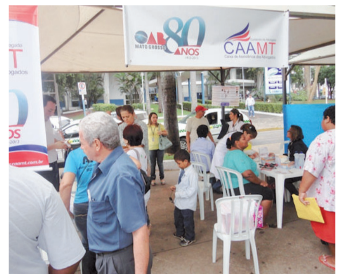
OAB 80 ANOS - PRAÇA ALENCASTRO