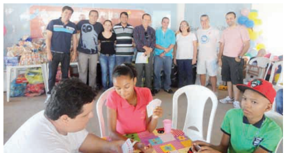
DIA DAS CRIANÇAS