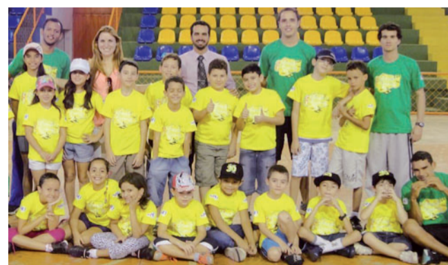
COLÔNIA DE FÉRIAS BARRA DO GARÇAS