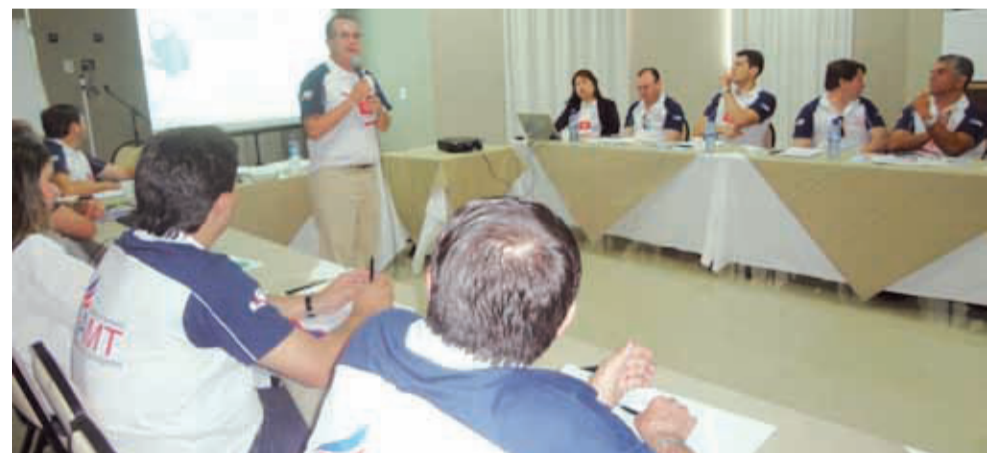
COLÉGIO DE DE ADVOGADOS - RONDONÓPOLIS